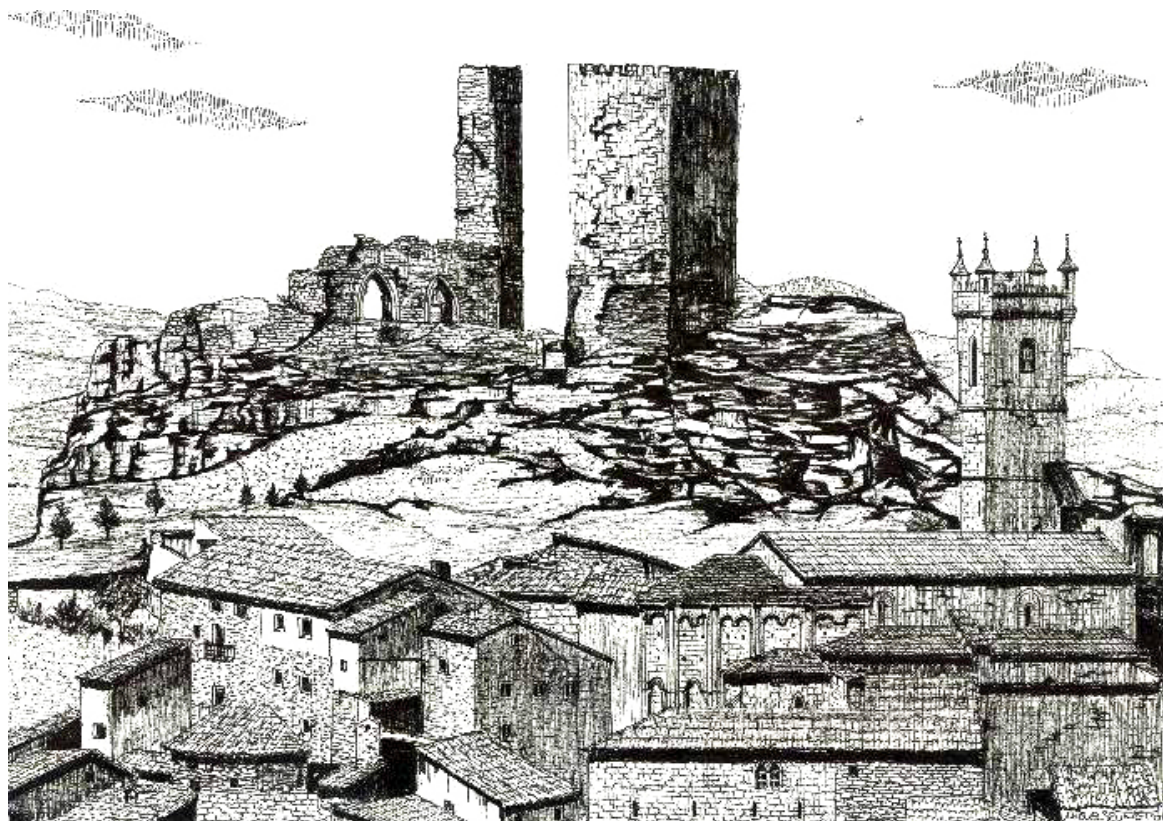
MIGUEL BRUNET CASTELLS